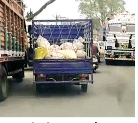
हरिभूमि न्यूज ॥ बैतूल

बडोरा क्षेत्र की कृषि उपज मंडी के पास शुक्रवार को एक बार फिर भारी ट्रैफिक जाम लग गया। बैतूल-मुलताई-आठनेर मार्ग पर उपज लेकर आने वाले ट्रैक्टरों और मालवाहक वाहनों की लंबी कतारें लगने से सामान्य यातायात बुरी तरह प्रभावित हुआ है। यह समस्या मंडी खुलने के समय अक्सर देखने को मिलती है। ट्रैक्टरों और मालवाहक वाहनों की कतारों मंडी के भीतर से निकलकर मुख्य मार्ग तक पहुंच जाती हैं। इसके कारण आम परिवहन वाहन और राहगीर जाम में फंस जाते हैं। त्योंहारी सीजन या छुट्टियों के बाद जब मंडी खुलती है, तो जाम की यह स्थिति और भी गंभीर रूप ले लेती है।