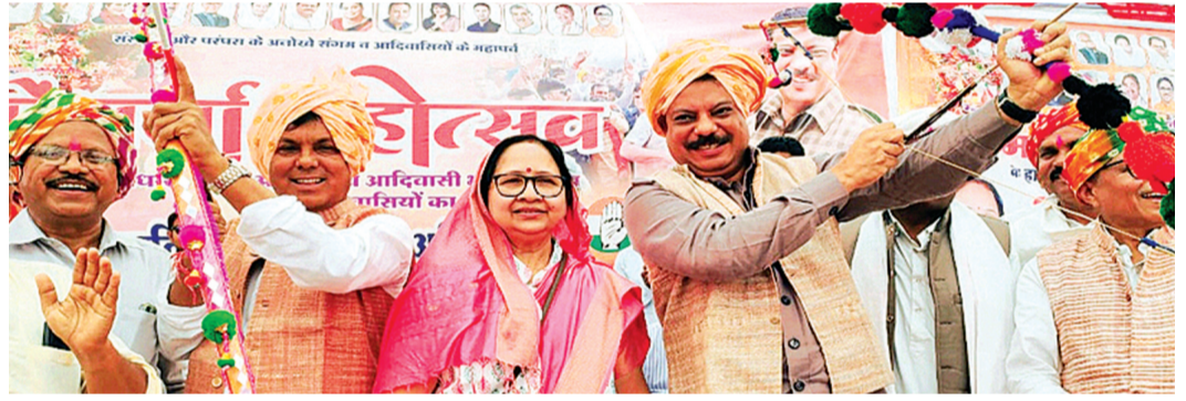
हरिभूमि न्यूज | झिरन्या