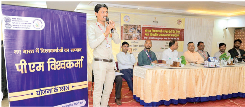
हरिभूमि न्यूज | हरदा

जिला प्रशासन हरदा के सहयोग से शुक्रवार को पीएम विश्वकर्मा योजना के लाभार्थियों के लिए एक दिवसीय जागरूकता कार्यक्रम का आयोजन होटल रुद्राक्ष पैलेस हरदा में किया गया। कार्यक्रम