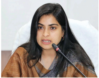
की जाए। नजूल लीज नवीनीकरण के मामलों के शीघ्र डिस्पोजल के लिए भी व्यवस्थित योजना बनाकर कार्रवाई करने के निर्देश दिए गए।

कलेक्टर ने निर्देश दिए कि चालू वित्तीय वर्ष की समाप्ति तक राजस्व वसूली में उल्लेखनीय प्रगति लाए। सूचीबद्ध प्रतिष्ठानों को नोटिस जारी कर यह सुनिश्चित किया जाए कि गत वर्ष की तुलना में राजस्व वसूली कम न रहे।