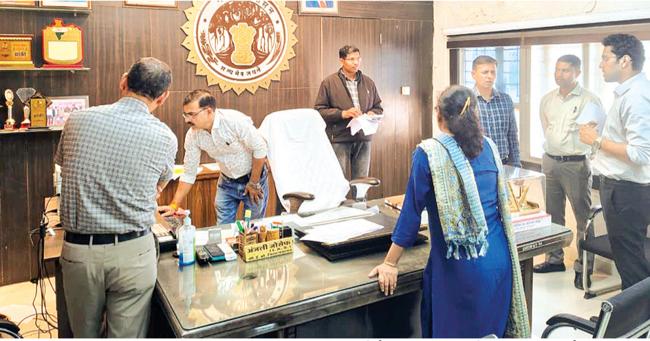
हरिभूमि न्यूज | हरदा