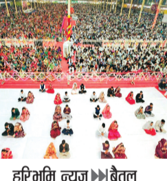
हरिभूमि न्यूज ॥ बैतूल

संत रामपाल महाराज के सान्निध्य में सतलोक आश्रम उद्घटन में महा विशाल भंडारे का आयोजन किया जा रहा है। तीन दिनों तक चलने वाले इस महाविशाल समागम में लाखों की तादाद में भक्तगण आकर भंडारा प्रसादी ग्रहण कर रहे हैं। शुक्रवार को कार्यक्रम के दूसरे दिन संत गरीबदास महाराज के बोध दिवस के उपलक्ष्य में 26 से 28 फरवरी तक महा विशाल समागम मनाया जा रहा है, जिसमें 3 दिवसीय महा विशाल भंडारा व संत गरीबदास महाराज की अमृतमय वाणी का अखंड पाठ आयोजित किया गया है, साथ ही अन्य कार्यक्रम जैसे रक्त दान शिविर, देहदान शिविर, दहेज मुक्त विवाह का आयोजन किया गया। इस बार 30 जोड़ों का दहेज मुक्त विवाह संपन्न हुआ जो महज 17 मिनट में